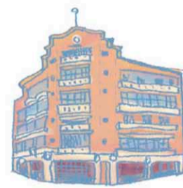
林百貨/ 鄭成功祖廟 林百貨/鄭成功祖廟