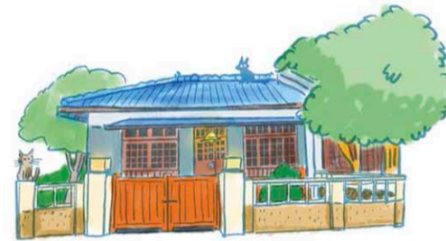
321巷藝術聚落 321 巷アート集落