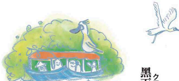
黑面琵鷺生態展示館 クロツラヘラサギ生態展示館