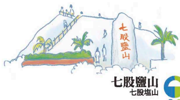
七股鹽山 七股塩山