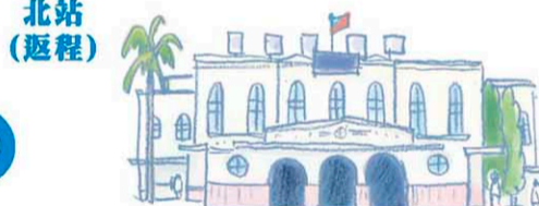
臺南火車站 台南駅