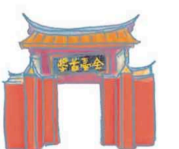
建興國中(府前路) 建興中学校(府前路)