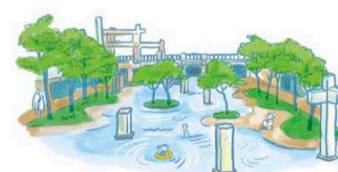
河樂廣場 河楽広場