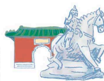
延平郡王祠(府前路) 延平郡王祠(府前路)