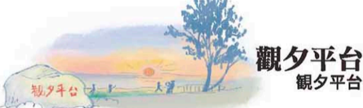
觀夕平台 観夕平台