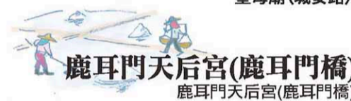
鹿耳門天后宮(鹿耳門橋) 鹿耳門天后宮(鹿耳門橋)